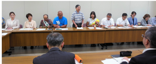
愛知県に要請する平和行進の参加者ら

県議会本会議では、共産党県議団が3回にわたってこの問題をとりあげていますが、「核兵器禁止条約をめぐるのは、国際情勢などを踏まえた国の考え方があり、慎重な対応が必要」という答弁を繰り返しています。