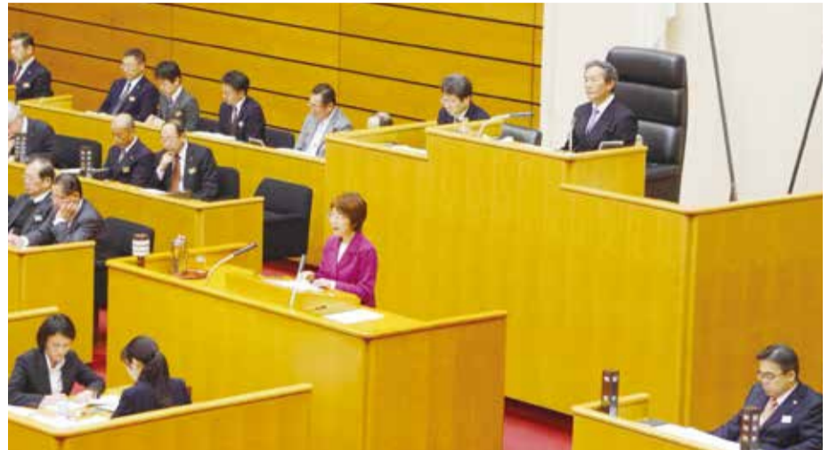
反対討論を行うわしの議員

日本共産党県議団は現場を調査し、暮らし・福祉・教育の充実について提案し、県に実現を求めました。