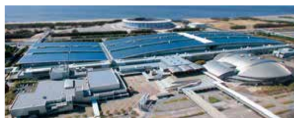
稼働率が悪く苦しい経営が続く幕張メッセ(千葉市)

水需要は間に合っているのに、総額3千億円、県負担1,400億円の設楽ダムの本體工事にも着工します。