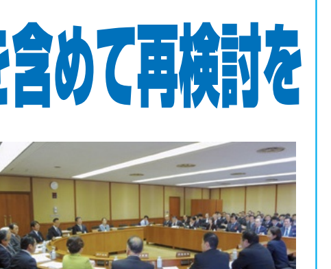
振興環境委員会(奥右端が下奥議員)